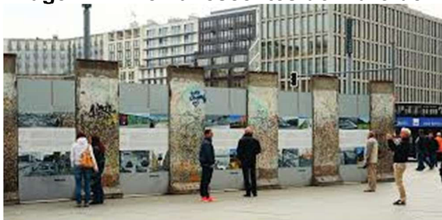
Imagem 1 – Remanescentes do Muro de Berlim 2014.

Observe e analise as imagens 1 e 2, e leia o texto 1 para ampliar o seu repertório sobre o tema.